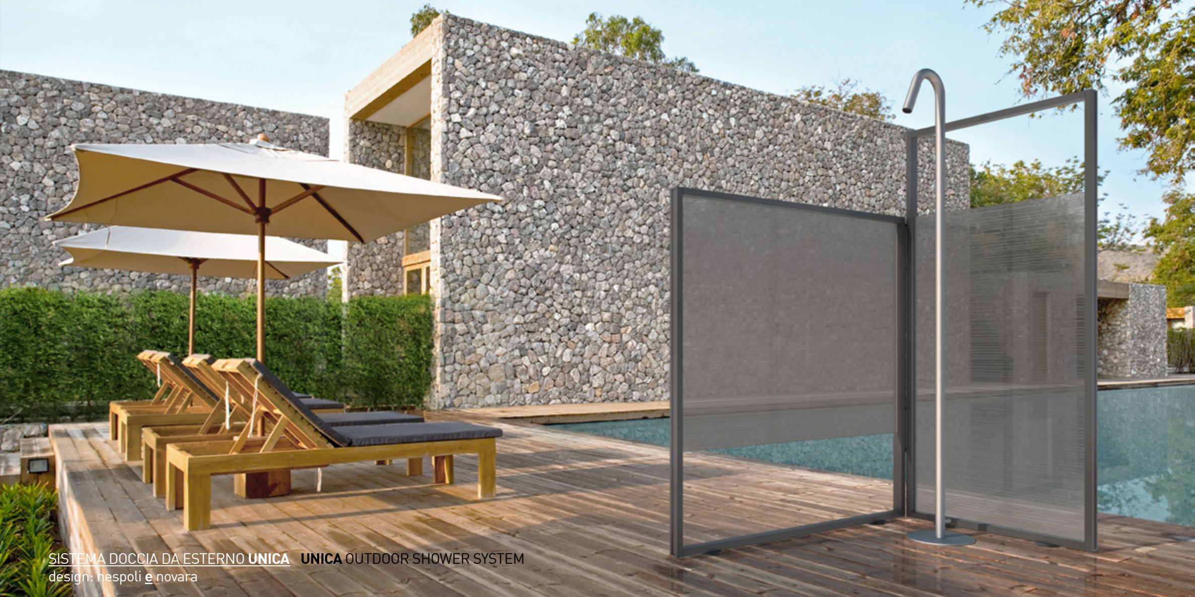
SISTEMA DOCCIA DA ESTERNO UNICA UNICA OUTDOOR SHOWER SYSTEM design: hespoli e novara