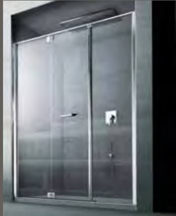
RM su misura sur mesure on measure nach Mass a medida 95 > 139 h 195