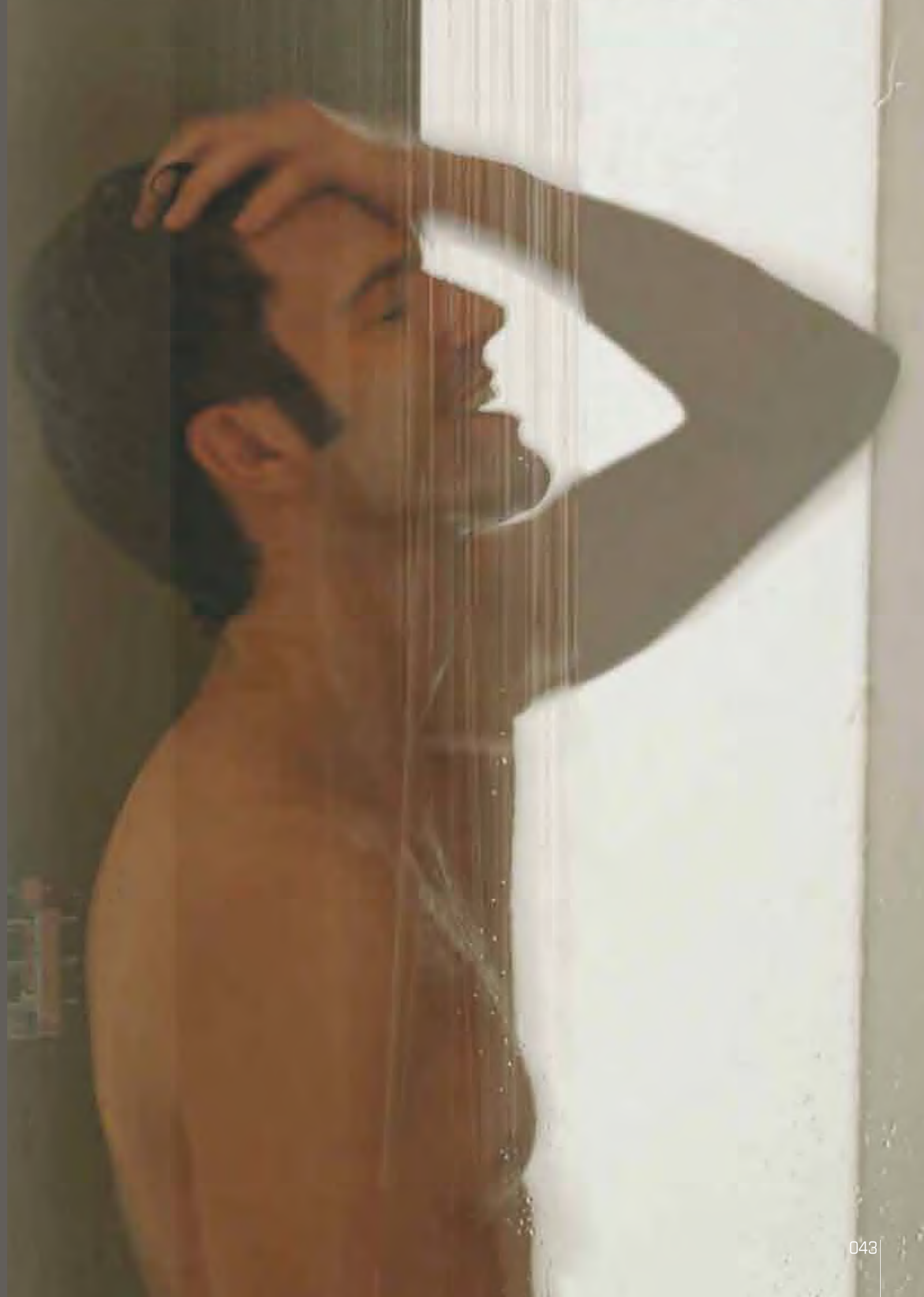
RF su misura sur mesure on measure nach Mass a medida 68 > 97 h 195