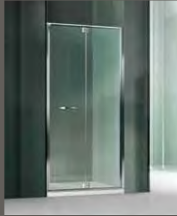
RN su misura sur mesure on measure nach Mass a medida 68 > 97 h 195