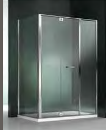
RM su misura sur mesure on measure nach Mass a medida 95 > 139 h 195