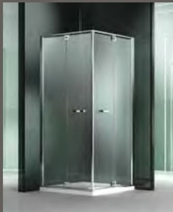
RA su misura sur mesure on measure nach Mass a medida 68 > 97 h 195