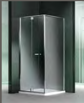
RA su misura sur mesure on measure nach Mass a medida 68 > 97 h 195